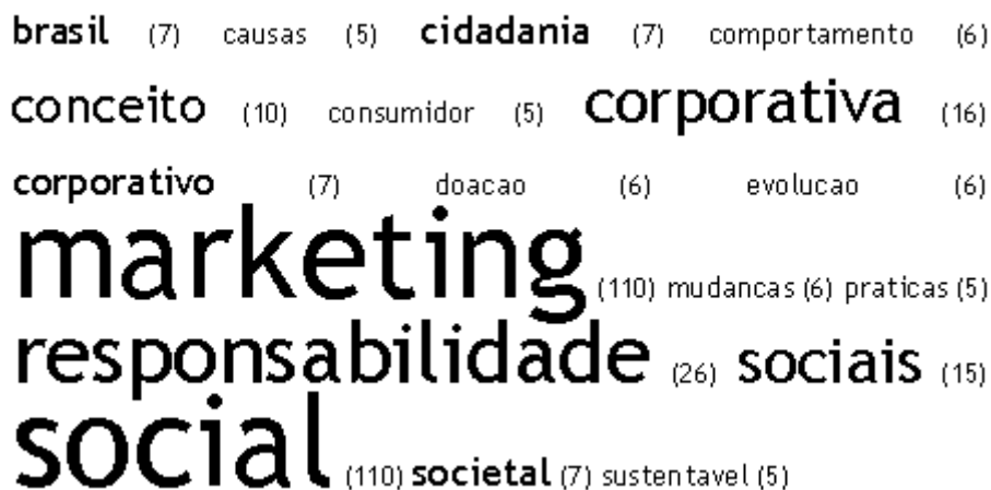
Figura 3 – Nuvem das palavras encontradas nos títulos dos tópicos adotados ao organizar o referencial teórico