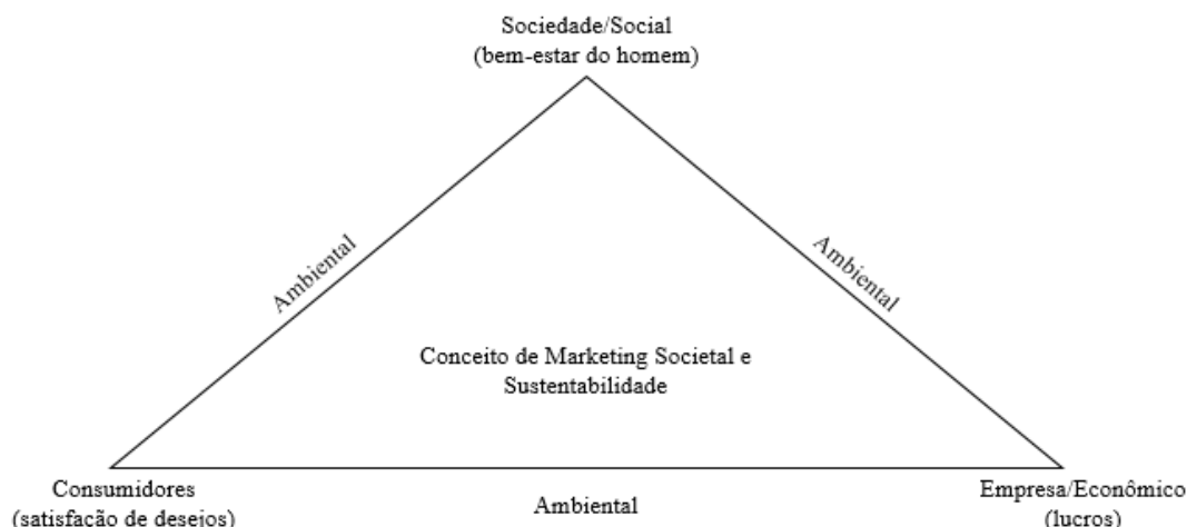
Figura 1 – Considerações subjacentes ao conceito de marketing societal e sustentabilidade