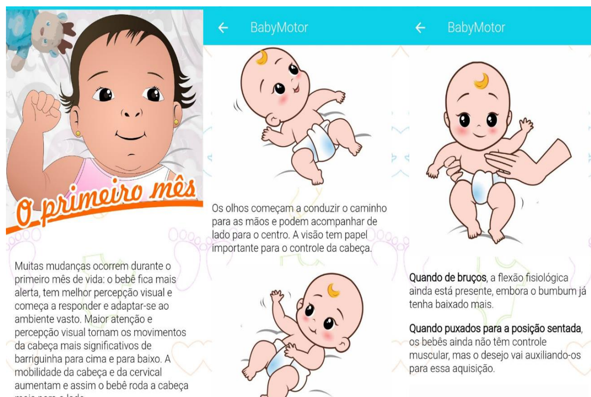
Figura 6: Telas do conteúdo principal do aplicativo.