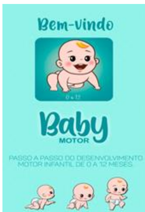
Figura 3: Tela inicial do aplicativo.