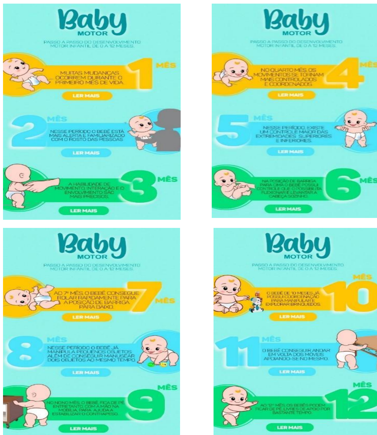
Figura 5: Telas dos ícones para cada mês do desenvolvimento.

Fonte: Textos do próprio autor e imagens gráficas feitas por uma designer.