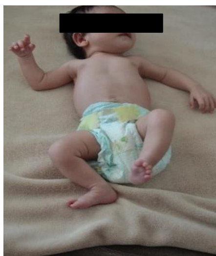
Figura 2: Criação das ilustrações a partir da imagem.