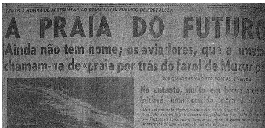
Figura SEQ Figura* ARABIC 1 - Correio do Ceará (edição n° 11.181), de 4 de março de 1949.

Foi a partir de uma fotografia aérea, estampada na primeira página do jornal Correio do Ceará em março de 1949, que uma praia, ainda sem nome, foi declarada como a praia do futuro. Sua área carecia então de qualquer infraestrutura e era bem conhecida e amada, conforme a reportagem, apenas pelos pilotos civis do Aéreo Clube.