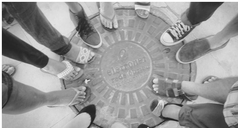
Figura 4: Tocando Pontos Terminais.

A figura 4 se refere a um momento conclusivo do Percurso Urbano, quando, após percorrermos distintos pontos terminais e diante de uma estação de cabo submarino da Level 3 , a primeira a